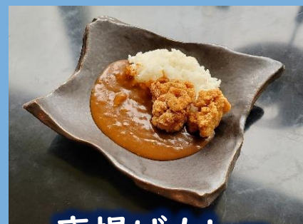
唐揚げカレー 800 円