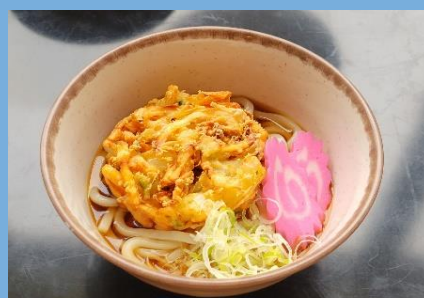
かきあげうどん 880 円 海老天うどん 880 円 かけうどん 600 円