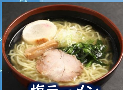
塩ラーメン 900 円