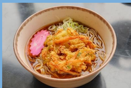
かきあげそば 880 円 海老天そば 880 円 かけそば 600 円