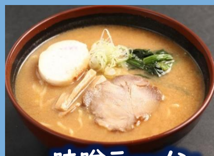
味噌ラーメン 900 円