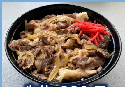
牛丼 880 円