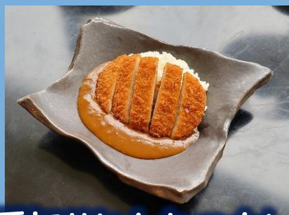
厚切りとんかつカレー 1200 円