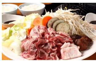
ジンギスカン(夕食)