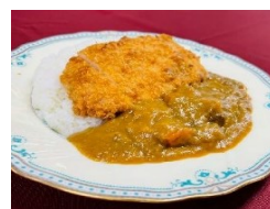
カツカレー 1,100円(昼食)