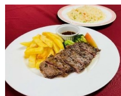
ステーキセット 1,320円(昼食)