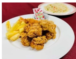
唐揚げエビフライセット 990円(昼食)