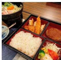
セットメニュー(夕食)

◆遠方からの送迎承ります 弊社提携バス会社もごしますので、別途お見積りいたします◆