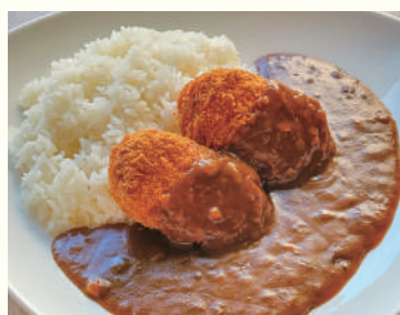
カニクリームコロケ カレー 1,000円