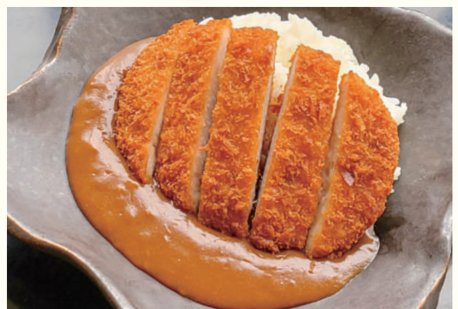
厚切りとんかつカレー 1,200円