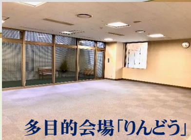
多目的会場「りんどう」

ホテルの目の前で、とても使いやすくて リーズナブルです たまには雑魚寝もいいものです 幼稚園お泊り会・学童クラブ・お仲間同士